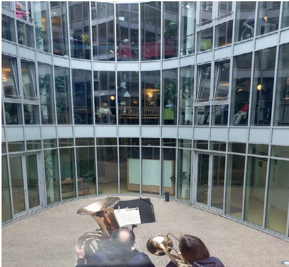
Unsere Bewohner*innen mit „Logenplätzen“: Posaunenkonzert im Hof

Die Freude war groß, als an Karfreitag das erste Mal für die Bewohner*innen des Hauses ein kleines Posaunenkonzert gegeben wurde.