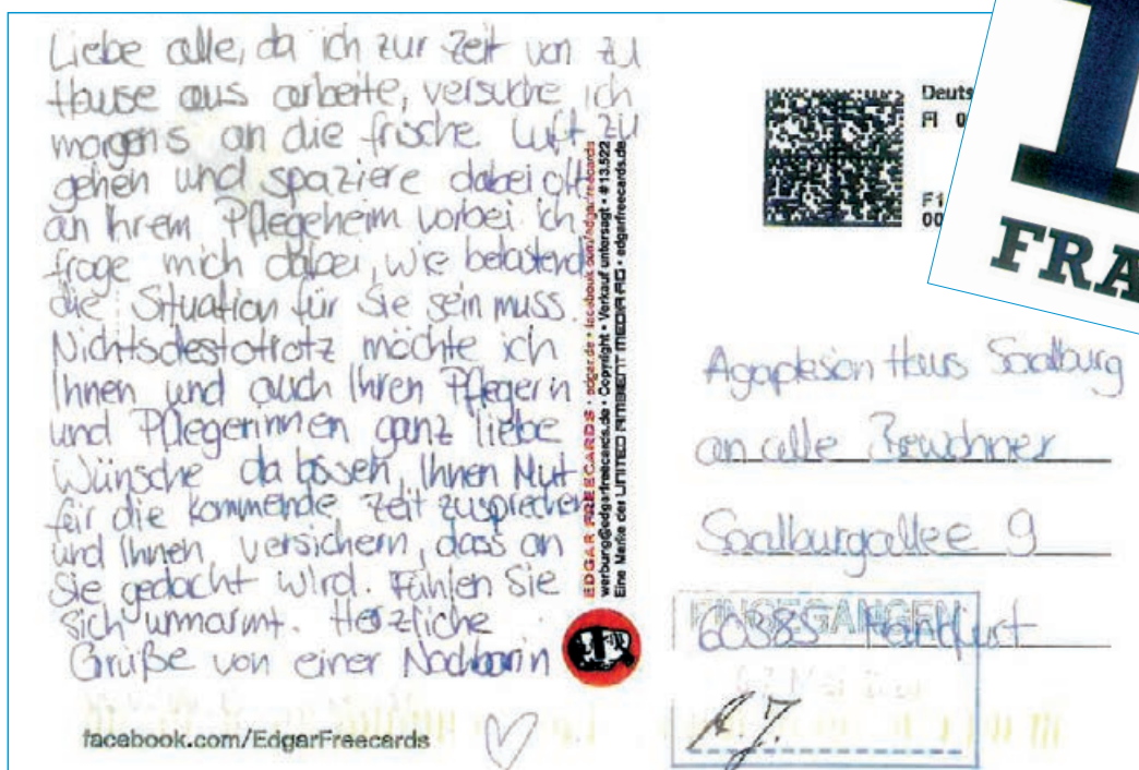
Dieser liebe Postkartengruß „von einer Nachbarin“ erfreute uns im Mai