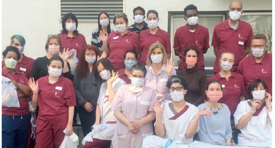
Unsere Mitarbeiter*innen präsentieren die Vielfalt der gespendeten Masken

Über 40 Helfer*innen haben teils aus eigenen Materialien, teils aus dem durch das AGAPLESION LOGISTIKZENTRUM erworbenen Stoff, mehr als 2.000 Stoffmasken in Handarbeit genäht. Diese wurden nicht nur im Schwanthaler Carrée, sondern auch in den anderen Einrichtungen der AGAPLESION MARKUS DIAKONIE verteilt, so dass die Mitarbeiter*innen bereits im April unabhängig von Lieferketten arbeiten konnten und die Bewohner*innen so zu jedem Zeitpunkt geschützt waren.