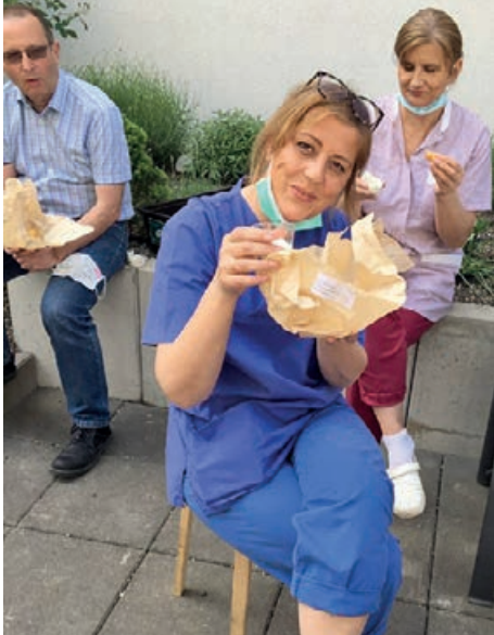
Lecker ... das schmeckt!

In Kooperation mit dem Gastronomieunternehmen „AVIO-Catering“ und im Vorfeld zum Tag der Pflege am 12.05.2020 wurden am Freitag davor für die gesamte Belegschaft des Schwanthaler Carrée Fish'n Chips geliefert. Bei sonnigem Wetter konnten wir es uns mit ausreichend Abstand auf der Dachterrasse gemütlich machen und die handgemachten Portionen Fischnuggets mit frittierten Kartoffeln und dazu die hausgemachte Remoulade genießen.