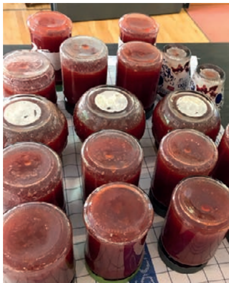
Ein Ergebnis: leckere Marmelade

Danke auch an das Küchenteam der AGAPLESION Catering, die uns immer reichlich mit dem frischen Obst und weiteren Zutaten versorgt hat, sowie allen fleißigen Helfer*innen aus unserem Wohnbereich, die mit dieser Aktion die Sommerzeit eingeläutet haben. ●