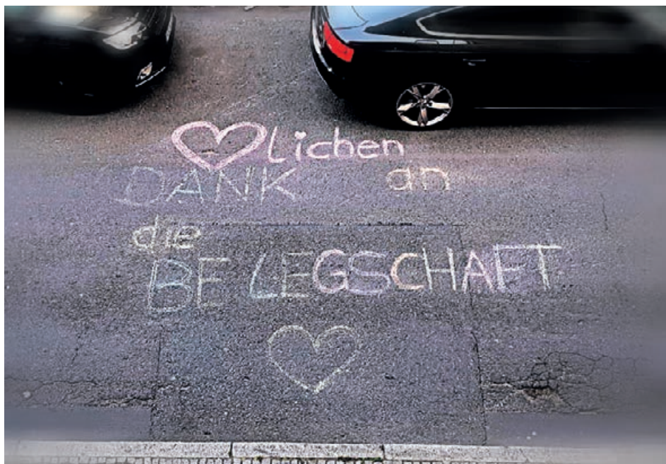
Anrührend: „Herzlichen Dank an die Belegschaft“ – für alle sichtbar gemacht

Dies freut uns natürlich sehr und bestärkt uns in unserem Handeln und gibt uns Kraft für all die Mühen. Danke auch an Sie! Ihr Haus Saalburg. ●