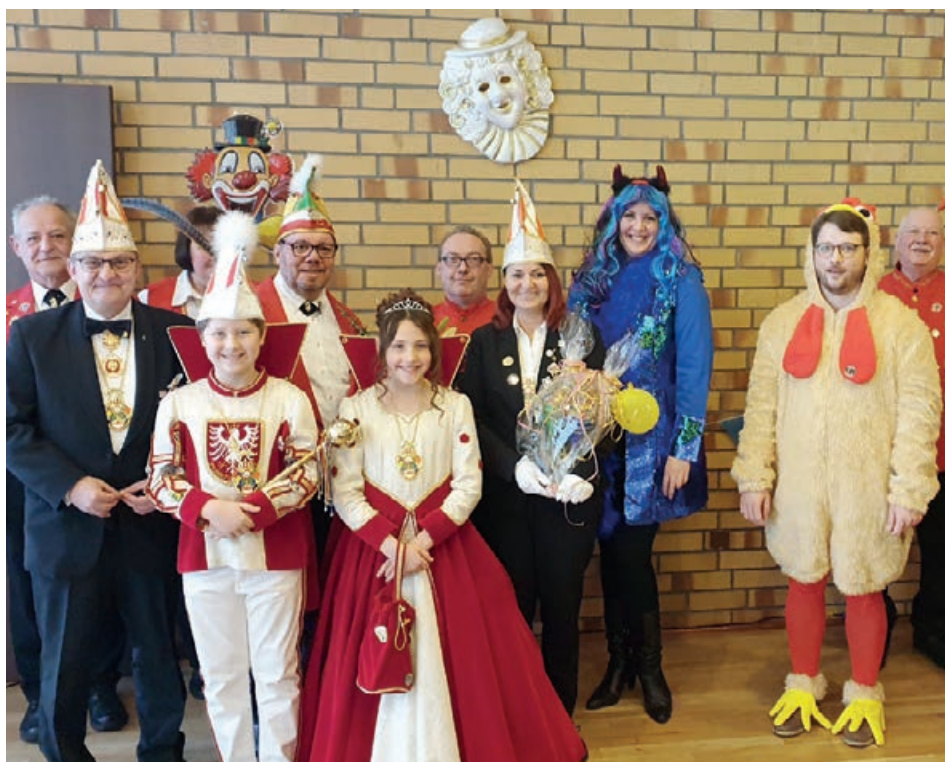
Der Karnevalsverein „Pierrette“ brachte sein humoristisches Programm zu unseren Bewohner*innen ins Haus Saalburg

Vier Wochen später wurde speziell im Demenzbereich noch einmal gefeiert. Hier boten die Mitarbeiter*innen der sozialen Betreuung ein vielfältiges Programm für unsere Bewohner*innen und die Stimmung war ausgelassen und fröhlich. So kann es gerne im nächsten Jahr weiter gehen. ●