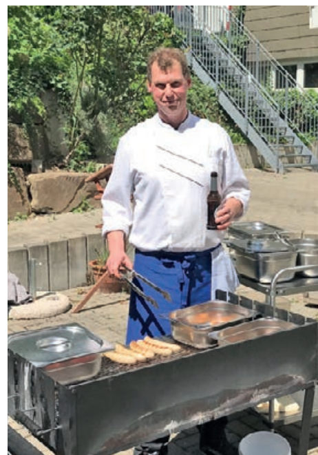
Grillfest für Mitarbeiter*innen im Hof

Unter Einhaltung der Abstandsregeln haben alle Mitarbeiter*innen Bratwurst und Nudelsalat genossen und sich sehr über diese Wertschätzung gefreut. ●