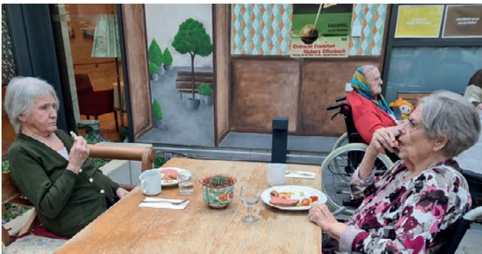
In gemütlicher Atmosphäre schmecken Handkäs' und Äppler

Unser Wintergarten ist dem „Kanonestepp“ (Äppler-Wirtschaft in der Textorstrasse) nachempfunden und bietet viele Möglichkeiten, hier bei einem kühlen Glas und einem zünftigen Abendbrot den Tag ausklingen zu lassen. ●