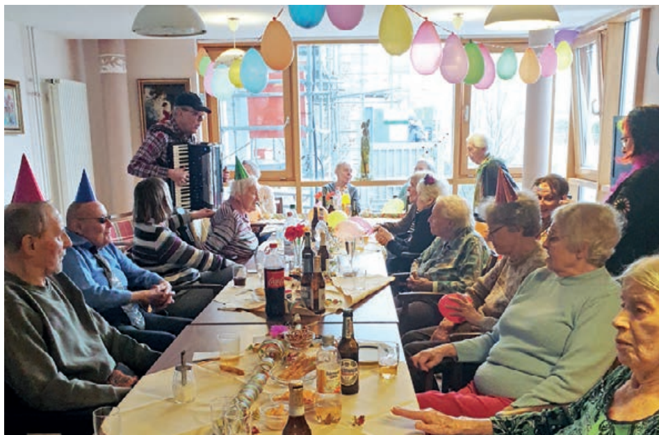
Gemeinsame Faschingsfeier mit „buntem Programm“