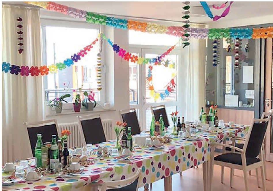
Unsere Mitarbeiter*innen ließen fast keinen Winkel ungeschmückt: Karnevalsdekoration in allen Räumen

Am 25.02.2020 war es wieder soweit: Faschingsdienstag – es wird bunt und laut bei uns im Haus Salem.