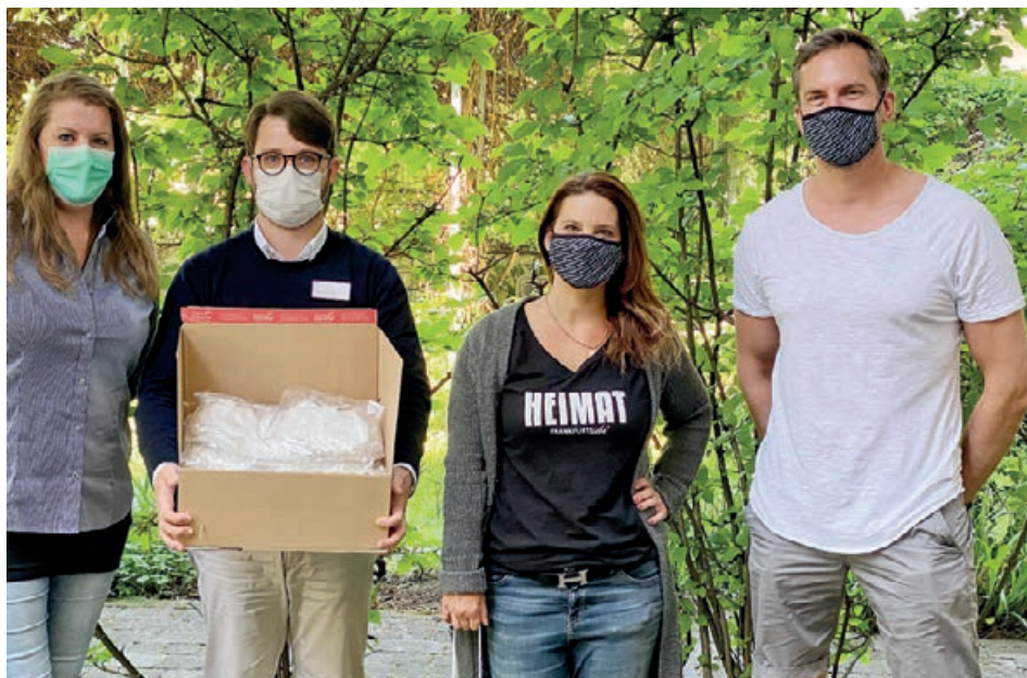
Sorgfältig genähte und fantasievoll gestaltete Alltagsmasken für unsere Einrichtungen

In schweren Zeiten stehen die Menschen zusammen. Man hilft, wo man kann und Hilfe benötigt wird oder Dinge fehlen – wie die wichtigen Schutzmasken.