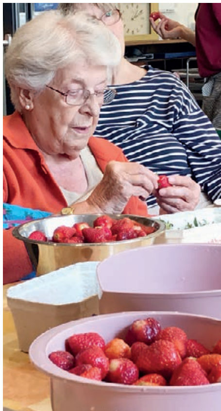
Akribisch wurden die Früchte vorbereitet