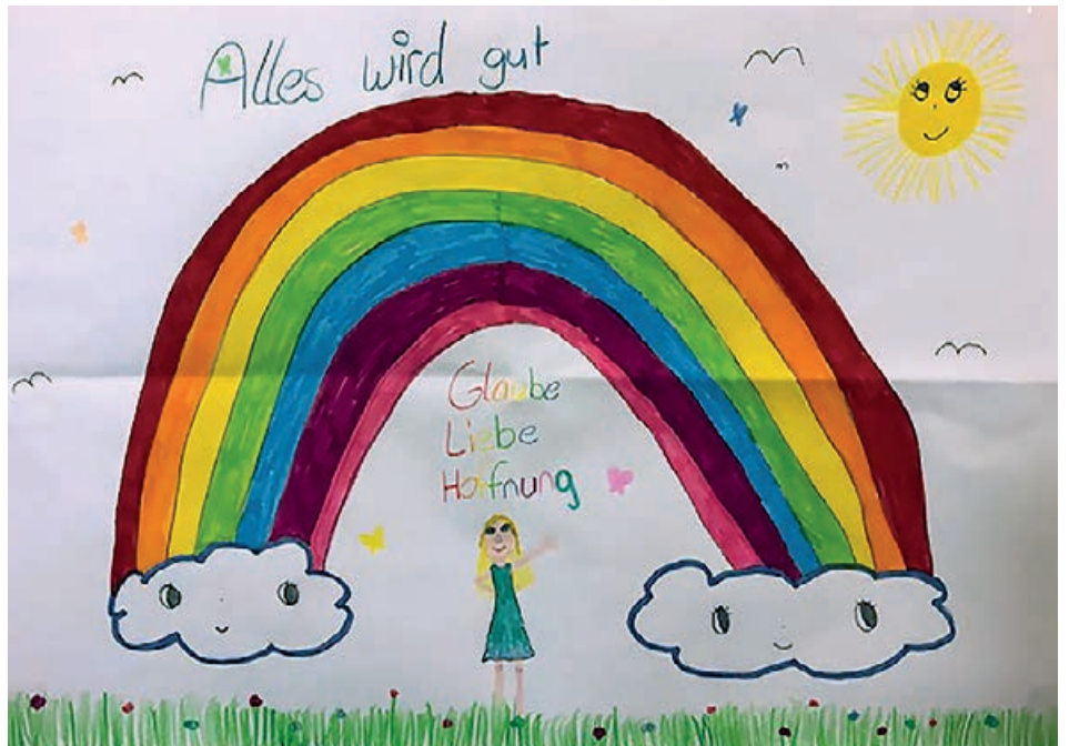
„Glaube, Liebe, Hoffnung“ und andere Motive mit aufmunternden Brieftexten

Während der Corona-Krise und des Besuchsverbotes im OMK haben zwei junge Mädchen mit selbstgemalten Bildern und Briefen ihre Anteilnahme ausgedrückt.